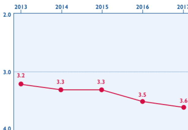
SZERVEZETI KAPACITÁS MAGYARORSZÁGON

Ilyen körülmények között a szakemberek megtartása továbbra is komoly problémát okoz a legtöbb civil szervezetnek, különösen a kisebbeknek. A legfrissebb hivatalos statisztikák szerint az ágazat alkalmazottainak száma 2015 és 2016 között nem változott. A civil szervezetek gyakran részmunkaidős, projekt alapon foglalkoztatják a munkavállalókat, és amint elfogy a támogatás, nincs módjuk arra, hogy tovább foglalkoztassák őket. Az olyan szakfeladatokat, mint a könyvelés és a jogászai munka, általában kiszervezik. A legtöbb civil szervezetnek nincs